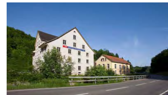
bestehende Gebäude Umgebung